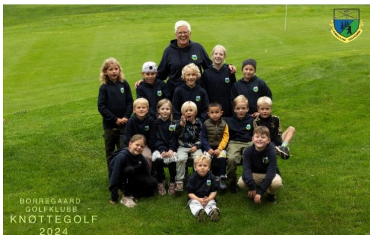
Knøttegolf gjengen 2024 (alder 6-12)

BoGK inngikk et nytt samarbeid med Skjeberg GK i 2024, hvor vi satte ned prisen for medlemskap for alle juniorer som inkluderte gratis juniortreninger for alle, samt at vi la til rette for kreative treninger og muligheter til å konkurrere på alle nivåer på hjemmebane og andre steder i regionen. Dette har vist seg til å ha vært en stor suksess da vi nå har 159 juniormedlemmer i klubben. Vi har treninger for alle aldre, fordelt på 3 ulike treninger.